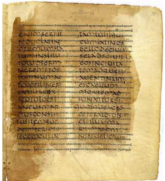
Palimpsesto "De Re Publica" de Cicerón