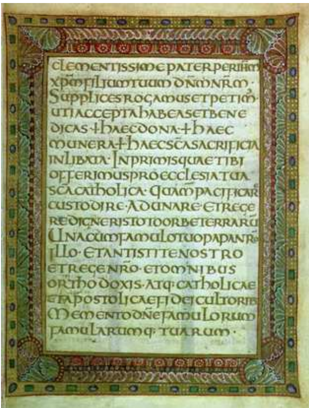
Sacramentario de Metz

Se conservan aproximadamente 500 manuscritos escritos con letra uncial, la mayoría de ellos conteniendo obras cristianas, aunque sin duda el más famoso manuscrito es el palimpsesto del siglo IV d.C. que contiene el “De Re Publica” de Cicerón.