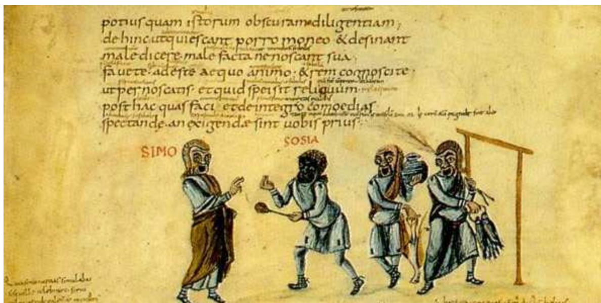
Fragmento de un manuscrito de Terencio escrito en carolina minúscula alrededor del año 825 d.C.

Así, mientras que las victorias militares y los manejos políticos deberían servir para adquirir poder y territorio, la cultura debería mantener la sociedad en unas cotas intelectuales nunca antes alcanzadas.