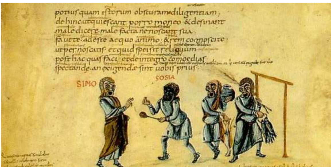
Fragmento de un manuscrito de Terencio escrito en carolina minúscula alrededor del año 825 d.C.

Así, mientras que las victorias militares y los manejos políticos deberían servir para adquirir poder y territorio, la cultura debería mantener la sociedad en unas cotas intelectuales nunca antes alcanzadas.