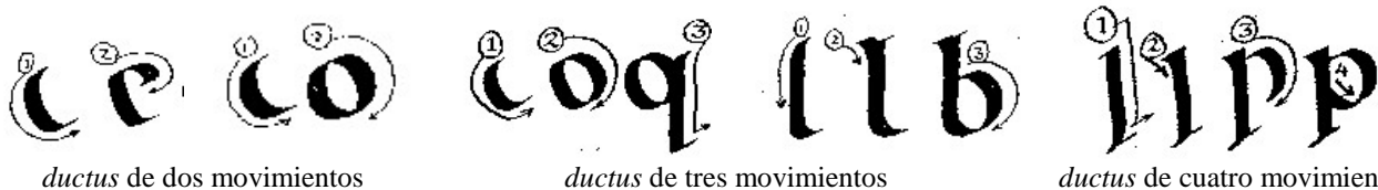
ductus de dos movimientos

Muestras del ductus de las letras "c", "o", "q", "b" y "p":